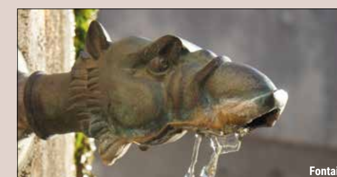
Le Saint-Laurent, Chemin de la Brèche