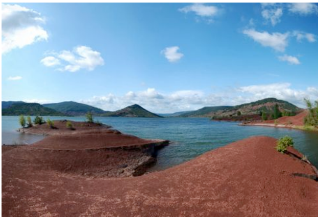
Le Lac du Salagou

Située à quelques minutes des Georges de l'Hérault, à proximité de Saint-Guilhem le désert, de la grotte de Clamouse. A 20 km du Lac du Salagou, du Cirque de Mourèze, 25 km de Montpellier, 30 km du cirque de Navacelles, du Larzac (la Couvertoirade, village fortifié des Templiers), 45 km des plages (Sète, Frontignan, Maguelone...), nombreux marchés de produits locaux (Aniane, Gignac, Clermont l'Hérault ...)