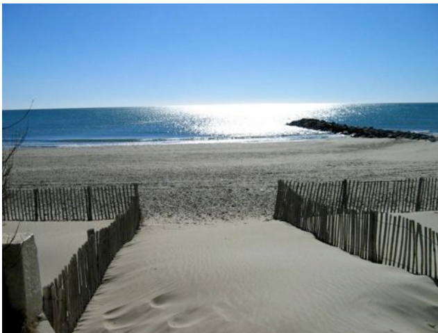
Les Plages du Littoral