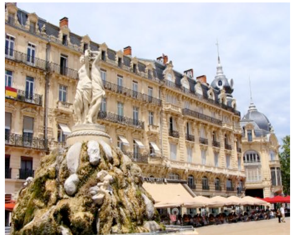
Montpellier, Place de la Comédie