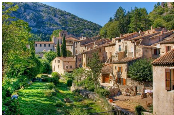
Saint-Guilhem le Désert