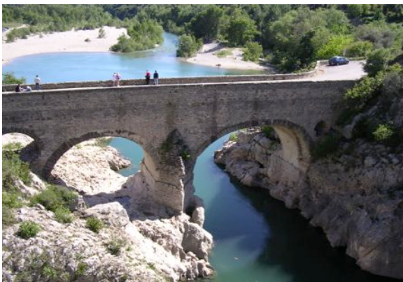
Georges de l'Hérault, Le Pont du Diable

Dans une ancienne maison de village récemment restaurée, location d'une grande chambre d'hôtes située près des Gorges de l'Hérault et de Saint-Guilhem le désert, à 45 min des plages, 30 min du Larzac et des Cevennes, 60 min du Mont Aigoual.