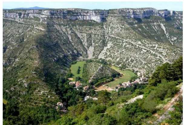
Le Cirque de Navacelles